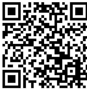
Krieg in der Ukraine