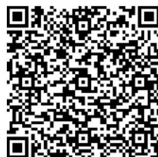
Kommentarfunktion in Word